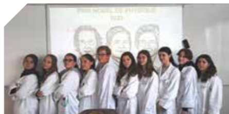
> 10 élèves de 3 e se sont portés volontaires pour animer des ateliers scientifiques auprès de 2 classes de CM2 des écoles Bony et Guimet.

Le collège Jean Renoir fête la science !