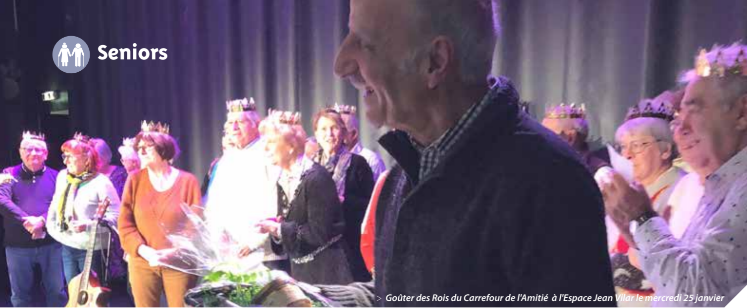
> Gouter des Rois du Carrefour de l'Amitié à l'Espace Jean Vilar le mercredi 25 janvier