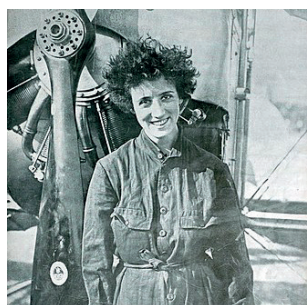
Adrienne Bolland (1895-1975)