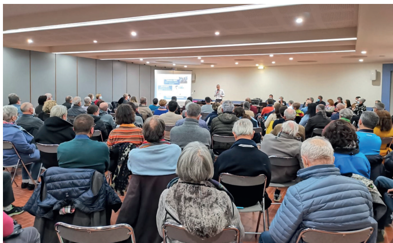
> Réunion publique de la municipalité à l'Espace Jean Vilar

Par ces propositions exclusivement féminines, notre équipe municipale s'engage pour une meilleure valorisation de l'image des femmes dans l'espace public, encore trop sous-représentées dans la dénomination des rues et des bâtiments publics.