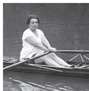
Alice Milliat (1884-1957)