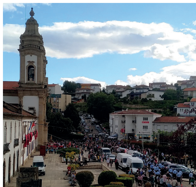
> Une délégation neuvilloise s'est rendue à Cabeceiras à l'occasion de la fête de Sao Miguel en septembre 2022

Nous avons fêté en 2022 le 25 ème anniversaire du jumelage avec Cabeceiras tandis que 2023 marquera le cinquantenaire de notre engagement avec la ville allemande d'Alpirsbach, qui sera célébré à l'occasion de plusieurs temps festifs. Ces deux anniversaires sont propices pour nous à relancer la dynamique de ces jumelages et de l'amitié entre les habitants de nos cités.