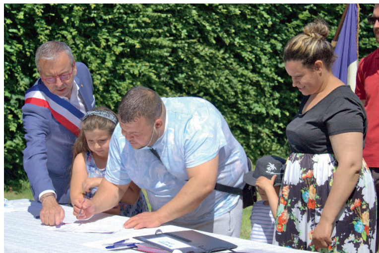
> Cérémonie de parrainage républicain à Neuville

Remettre le lien social au cœur de nos politiques publiques, c'est également renforcer la solidarité entre ceux d'entre nous qui sont installés, et ceux qui ont fui leur pays et se trouvent en grande précarité et sans papiers. Les parrainages républicains de demandeurs d'asile en sont l'illustration.