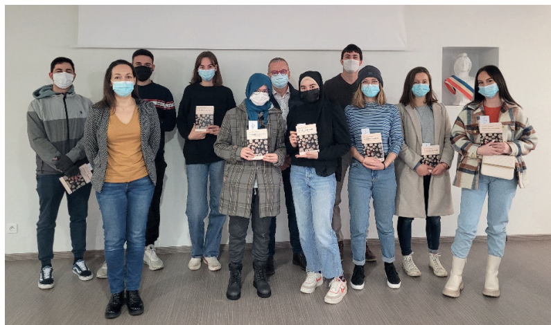
> Rencontre des élus et des bénéficiaires du Passeport Réussite

Nous avons aussi ouvert l'attribution du Passeport Réussite aux jeunes poursuivant leurs études supérieures en alternance.