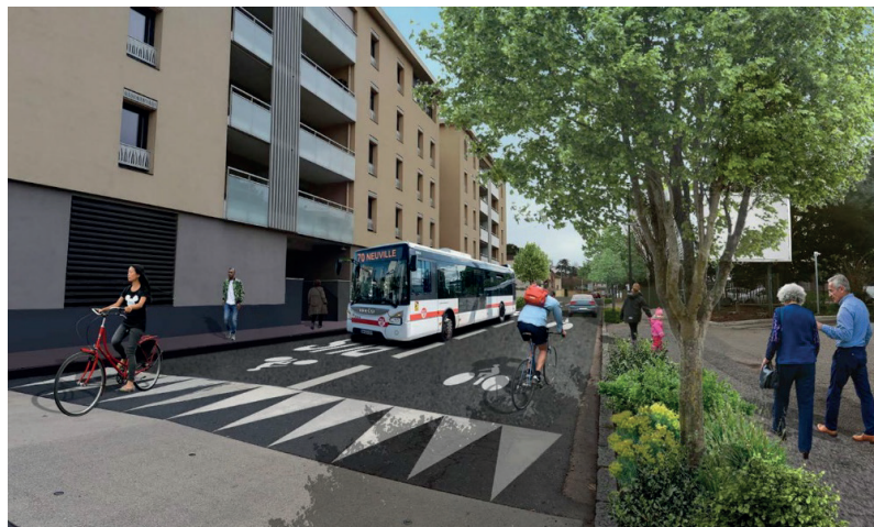
> Projet de corridor bus Aménagements en cours de l'avenue Burdeau

C'est aussi améliorer la qualité des services de transports en commun, en garantissant la régularité et la fiabilité des temps de parcours. La création d'un corridor bus par Sytral Mobilités et la Métropole de Lyon, dont les travaux ont débuté en 2022 sur l'avenue Burdeau, permettra notamment de répondre à cet enjeu.