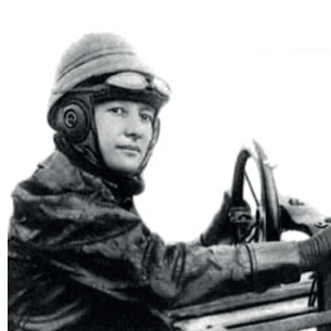
Marie Marvingt (1875-1963)