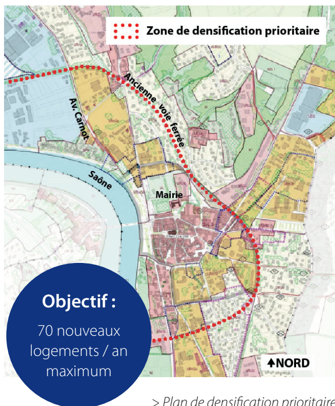
> Plan de densification prioritaire

Une ville où la densification urbaine, bien que nécessaire pour répondre à la croissance démographique et garantir la pérennité des commerces et services, est encadrée par la définition de secteurs prioritaires et la limitation du nombre de logements construits chaque année.