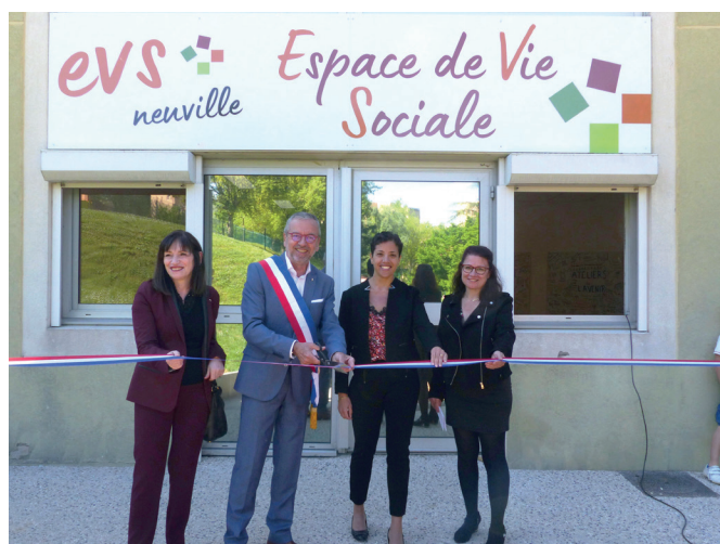
> Inauguration de l'Espace de Vie Sociale (Impasse de Prandières - Quartier de la Source)

Début mai, nous avons également eu le plaisir d'inaugurer l' Espace de Vie Sociale . Et là aussi, c'est une grande satisfaction pour nous de constater que cet espace vit et fonctionne, avec et par la mobilisation des habitants... et de sa coordonnatrice.