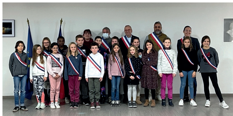
> 20 jeunes élus de CM1/CM2 composent le Conseil municipal des enfants

Nous avons la chance à Neuville d'avoir d'autres élus, plus jeunes... bien plus jeunes, et qui s'exercent aussi au débat démocratique. Avant de vous présenter l'avancement de nos projets, je vous invite à accueillir chaleureusement quelques jeunes élus du Conseil municipal d'enfants qui vont vous parler des actions en cours et à venir qu'ils engagent au sein des différentes commissions.