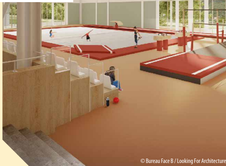
© Bureau Face B / Looking For Architecture

L'équipement comportera une salle multisports et une salle de gymnastique, des vestiaires et des locaux techniques plus adaptés, un plateau sportif extérieur et des aménagements paysagers. Le projet apportera une réponse pérenne en termes d'usages et d'accessibilité , tout en proposant un lieu ludique qui donne envie de pratiquer le sport, aussi bien en intérieur qu'en extérieur. Grâce à un choix de matériaux naturels et minéraux, l'équipement sera mieux intégré à son environnement et plus sobre au plan énergétique.