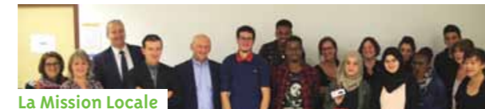
La Mission Locale

Horaires Ouvert du mardi au samedi : 9h-12h30 et 15h-19h Contact : 09 83 94 16 70