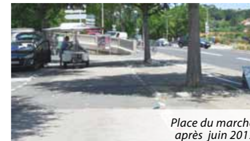
Place du marché après juin 2017