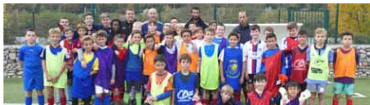
Merci aux annonceurs qui contribuent à la publication de ce magazine.

Le C.S Neuvilleois a organisé son stage d'automne 2017 avec 45 participants, qui ont pu assister à l'entraînement de l'Olympique Lyonnais. Certains jeunes ont déjà repris date pour le prochain stage de printemps !