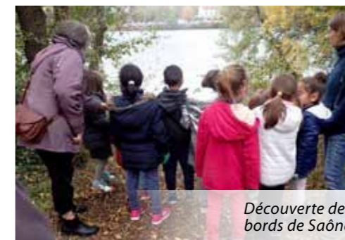
Découverte des bords de Saône

Dans le cadre des heures des découvertes et grâce au soutien de l'association « Neuville, Histoire et Patrimoine » et du Groupe Mycologique et Botanique du Val de Saône, 15 enfants de l'école de la Tatière sont partis à la découverte du patrimoine historique neuvilleois (tour de l'Écho, vieux Neuville, clos du Nymphée...) et naturel (bords de Saône, balade en forêt...). Quelles belles expériences pour les petits Neuvilleois ! Avec l'appui de leur animatrice, ils ont confectionné une maquette de leur ville mettant en valeur les trésors de la commune.