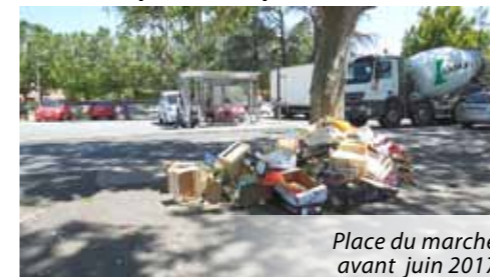
Place du marché avant juin 2017

Désormais tous les vendredis, les forains ramènent obligatoirement leurs déchets. Merci à eux pour leur implication.