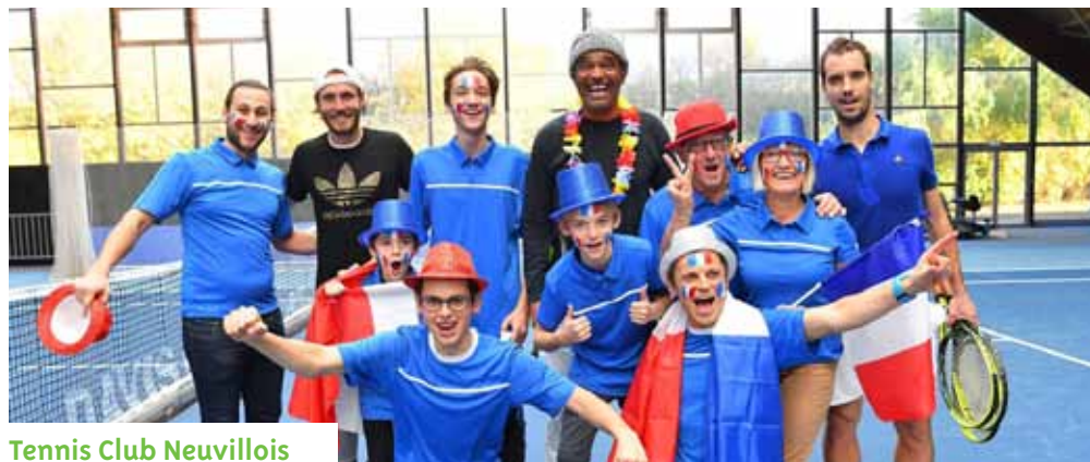
Tennis Club Neuvilleois

Pour l'activité « échecs » l'association recherche des joueurs pour renforcer cet atelier. N'hésitez pas à en parler autour de vous, si vous êtes intéressé(e) ou si vous connaissez des joueurs susceptibles d'être intéressés. Contact : carrefour.amitie.69250@gmail.com et permanence sur place tous les jeudis après-midi. Lieu : Clos du Billard, 16 rue Rey Loras,